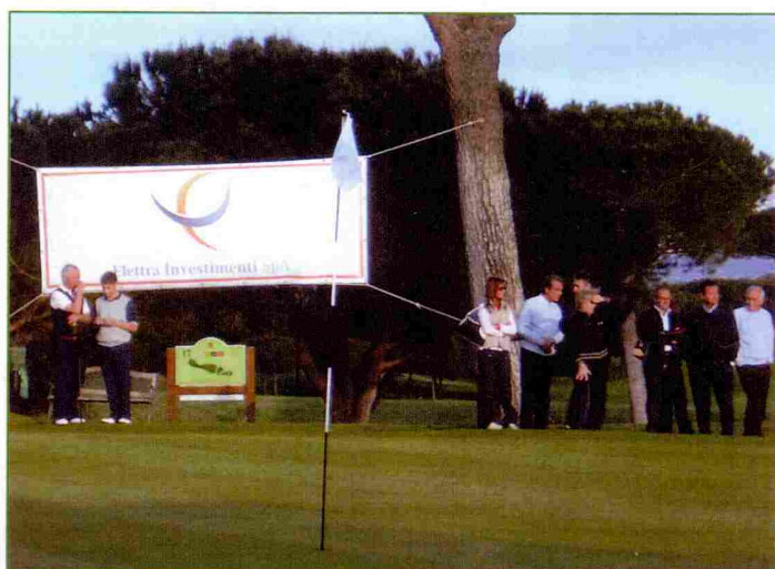
La testimonianza della prima sponsorizzazione della Coppa d'Oro Città di Roma - Trofeo Elettra Investimenti SpA

Elettra Investimenti è una holding industriale di partecipazioni nel settore energetico (Gruppo Elettra Investimenti). Il Gruppo, attraverso una serie di società operative sul territorio, promuove, realizza e gestisce impianti di produzione di energia, anche da fonti rinnovabili. Il modello di business a cui si ispira il Gruppo Elettra Investimenti si basa sulla realizzazione di impianti di produzione di energia di piccola/media taglia (in genere nella fascia